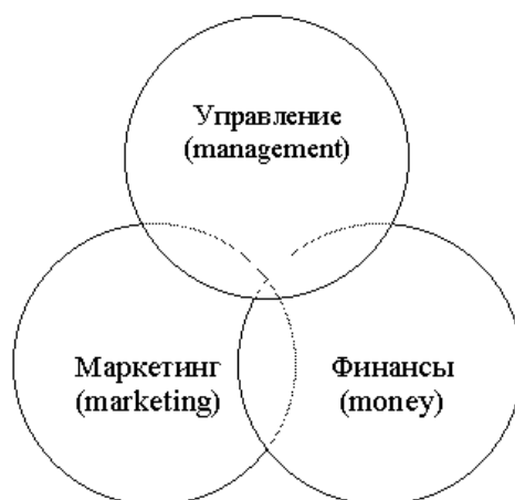
Рис.2. Ключевые составляющие бизнес-плана